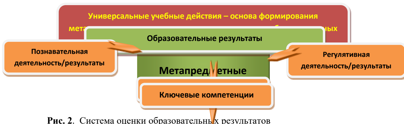
Рис. 2. Система оценки образовательных результатов

Интерпретация результатов оценки ведётся на основе контекстной информации об условиях и особенностях деятельности субъектов образовательной деятельности. В частности, итоговая оценка обучающихся определяется с учётом их стартового уровня и динамики образовательных достижений.