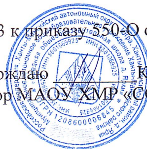
График работы инициативной группы по контролю за организацией горячего питания обучающихся МАОУ ХМР «СОШ д. Ярки» в 2022-2023 году